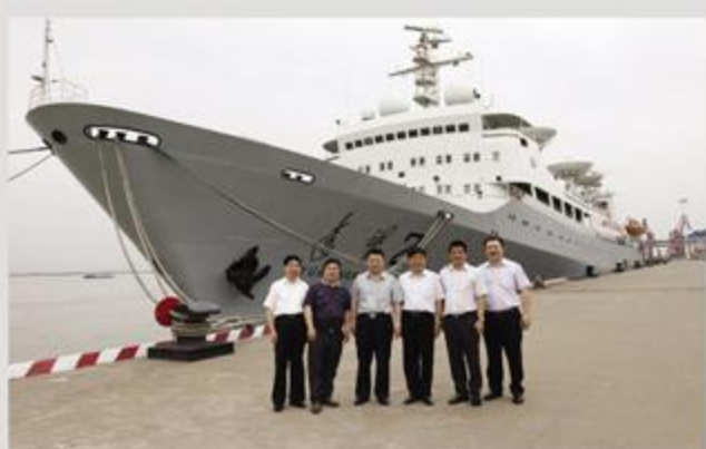
图为:商会代表团在江阴临港新城考察现场,并在远望号前合影。

下午,代表团一行还参观了“天下第一村”江阴华西村和航天远望2号测量船,使大家进一步了解了华西村的发展历程和远望2号船对我国航天事业发展所作出的杰出贡献(商会秘书处)。