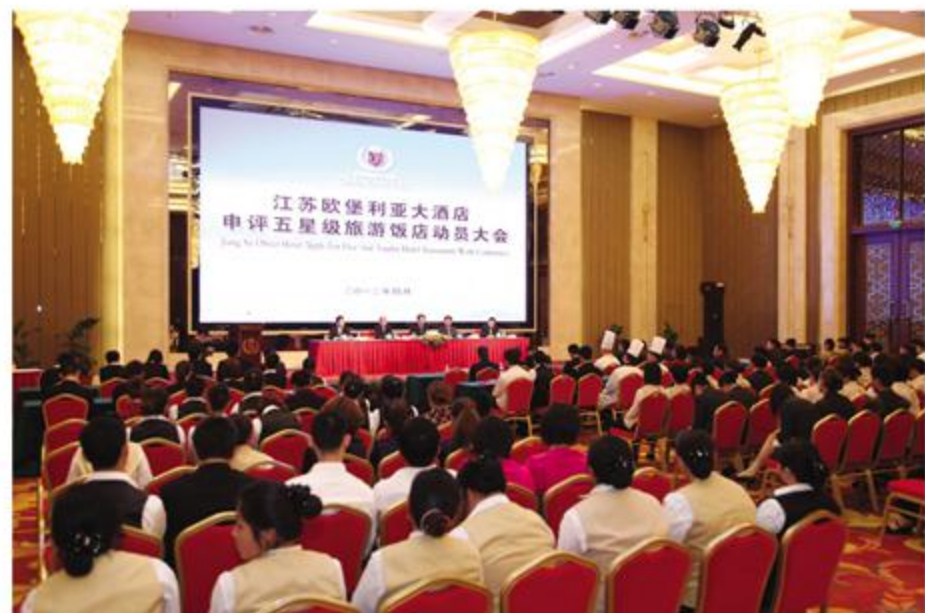
下图：申评五星级旅游饭店动员大会现场。