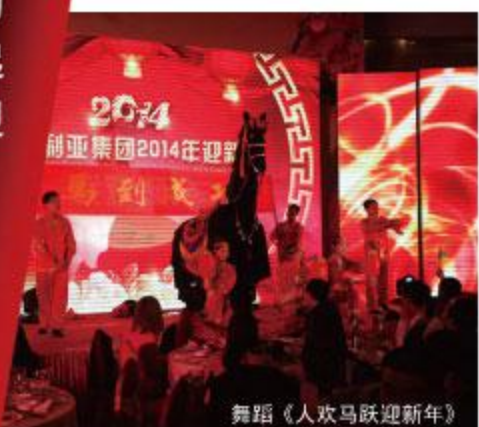
舞蹈《人欢马跃迎新年》