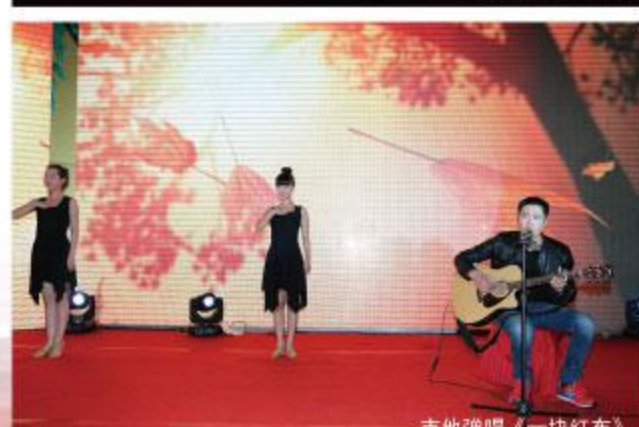
吉他弹唱《一块红布》