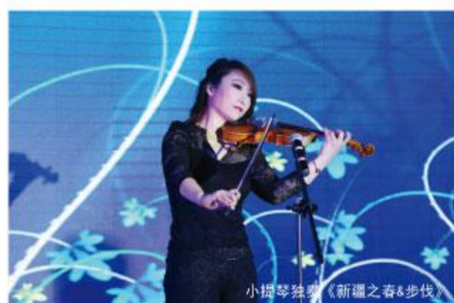
小提琴独奏《新疆之春&步伐》