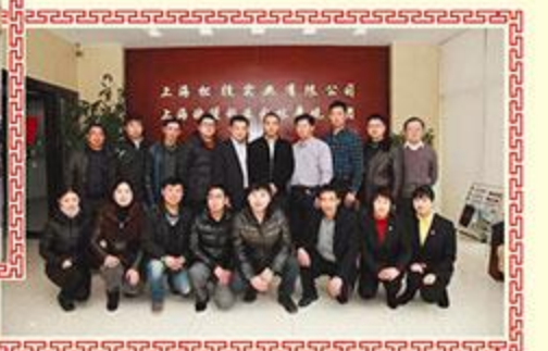
▲ 上海雅鹿房地产开发有限公司 上海滨宏园林绿化有限公司 上海坚华建材有限公司