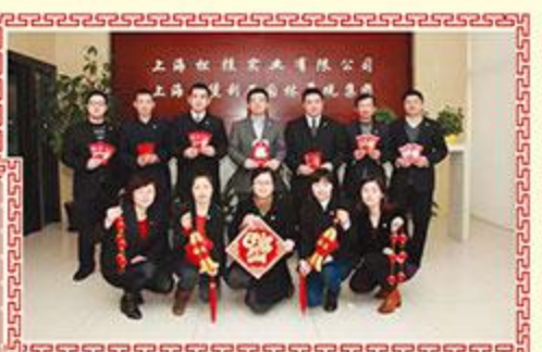
▲ 上海松投实业有限公司