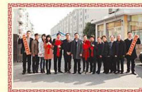
▲ 上海滨杰实业有限公司