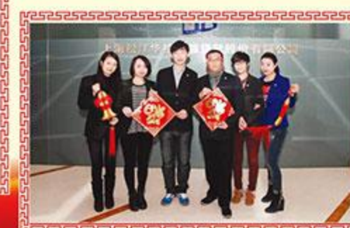
▲ 上海松江华松小额贷款股份有限公司