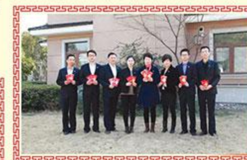
▲ 上海滨浩实业有限公司