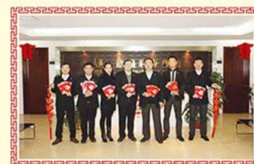
▲ 亚桥融资租赁有限公司