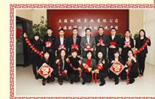
▲ 上海欧堡利亚园林景观集团有限公司