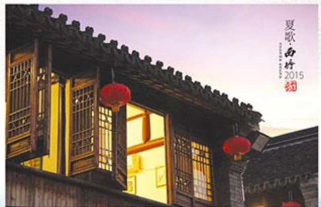
五月斜塘 (欧堡利亚集团 张璐远)