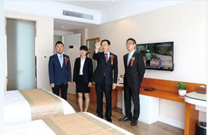
图为：集团领导视察酒店内部基础设施

7月18日上午10时18分，彩旗飘扬，鞭炮齐鸣，由欧堡利亚集团倾情打造的欧堡利亚·建湖格林豪泰酒店在欧堡利亚·尊园盛大开业，欧堡利亚集团酒店旗下又一颗闪亮的“新星”正式亮相。