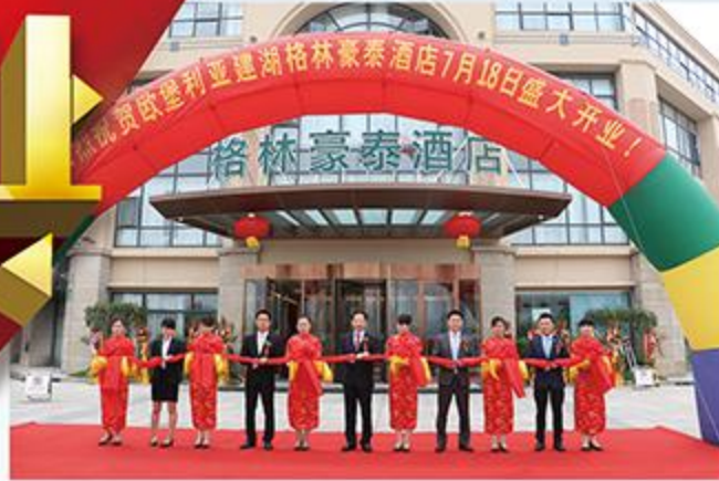
图为：酒店开业剪彩仪式