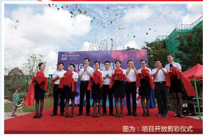
图为：项目开放剪彩仪式